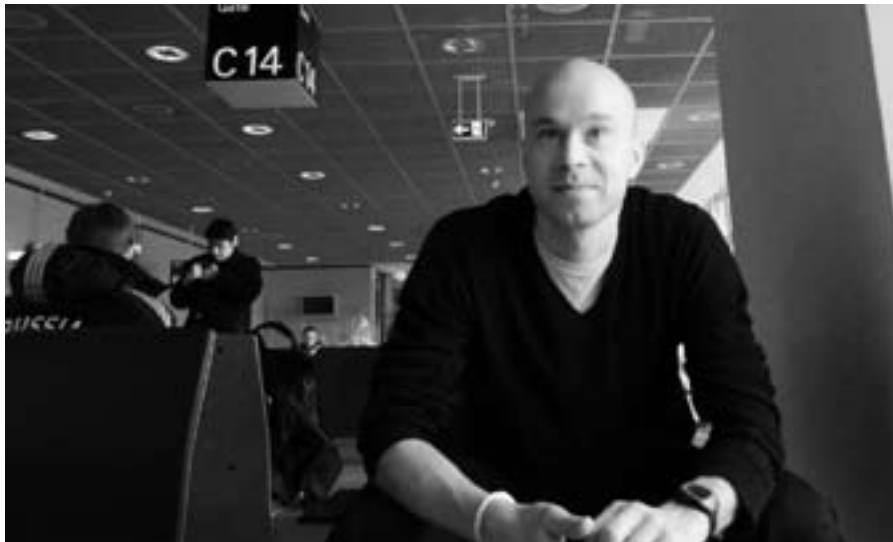
Frankfurtin kentällä , ennen lentoa Bostoniin (2011) .